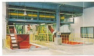
②③ 受入ホッパ・供給コンベヤ

貯留ヤードから重機で、または搬入車から受入ホッパへ直接ゴミを投入し、コンベヤで搬送します。