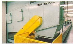
④ 破砕機・搬送コンベヤ

貯留ヤードから重機で、または搬入車から受入ホッパへ直接ゴミを投入し、コンベヤで搬送します。